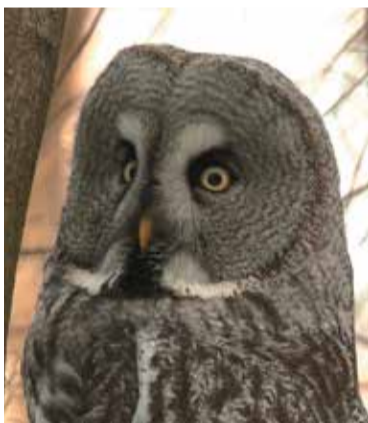
Лицо-локатор помогает сове в охоте