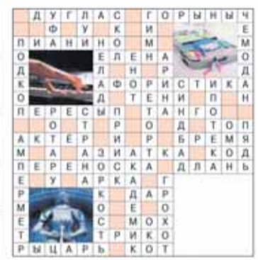
ОТВЕТЫ НА СКАНВОРД, ОПУБЛИКОВАННЫЙ В № 25, СТР. 23

14. Выводы и рекомендации по проведению публичных слушаний: публичные слушания признаны состоявшимися, заключение о результатах публичных слушаний подлежит обнародованию и опубликованию в порядке, установленном Уставом для опубликования (обнародования) муниципальных нормативных правовых актов поселения.