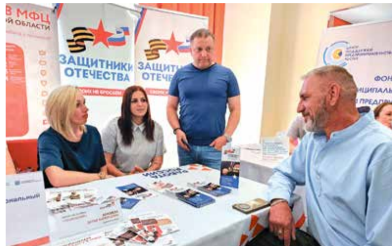
Фонд «Защитники Отечества» организовал консультации для ветеранов СВО на Всероссийской ярмарке трудоустройства «Работа России»

— Благодаря тесному сотрудничеству с Мультицентром социальной и трудовой интеграции возможности у наших соискателей есть. Было бы желание. Можно обучиться компьютерной графике, 1С-бухгалтерии, различным офисным программам. Сейчас идёт обучение на курсах операторов беспилотных летательных аппаратов. Мы буквально в прошлом году выпустили три потока таких. Граждане получили дипломы о переподготовке операторов БПЛА. Это весьма востребовано. К нам даже приезжали обучаться из других субъектов Российской Федерации —