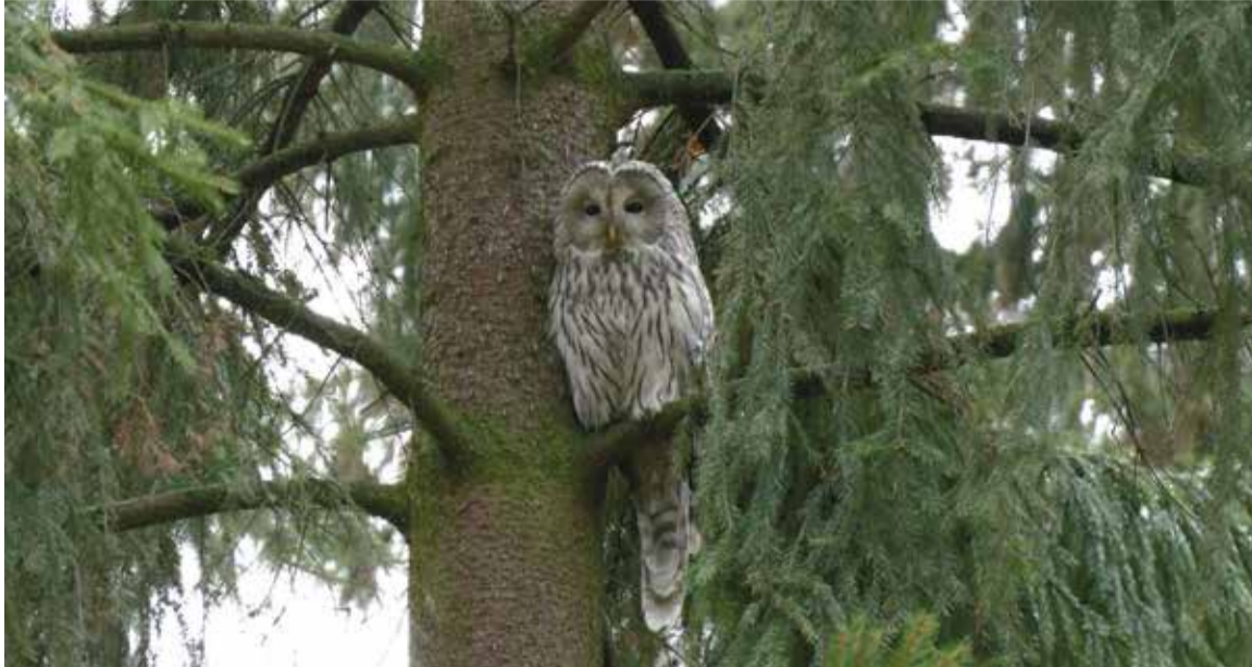
Размах крыльев длиннохвостой неясыти достигает 130 см