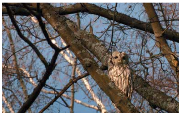
Серую неясыть можно встретить в лесах Ленобласти