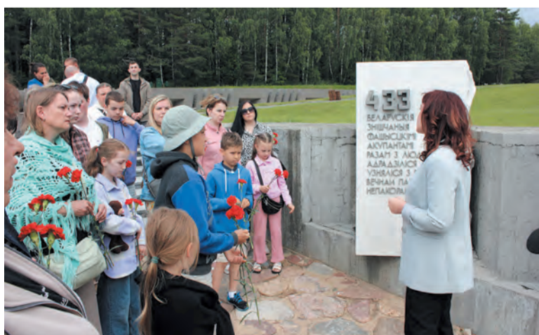
Жёны и дети участников спецоперации на экскурсии по мемориалу «Хатынь»

МАТЕРИАЛ ПОДГОТОВЛЕН ФОНДОМ «ЛЕНИНГРАДСКИЙ РУБЕЖ»