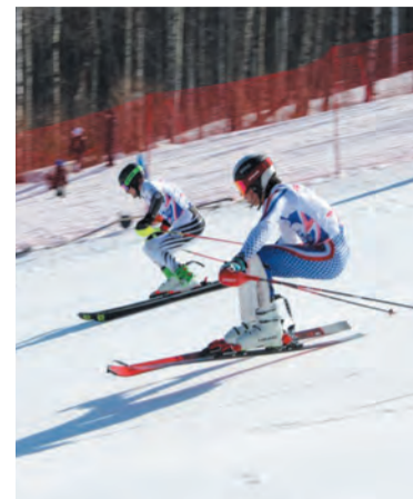
Горнолыжные курорты — визитная карточка района

Развивается и спортивная инфраструктура района. Тяжёлая атлетика, спортивная борьба, плавание, стрельба из лука, футбол, городошный спорт —