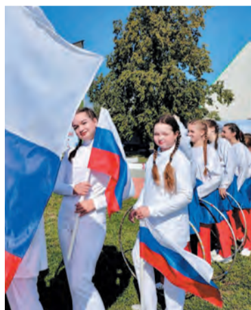
Молодёжь на праздновании Дня флага России

селка) и Громово (Центральная площадь). Всего с 2017 года по президентской программе благоустроены 22 общественных пространства и 35 дворовых территорий. В 2024 году планируется благоустроить ещё 6 территорий в Приозерске, Громово,