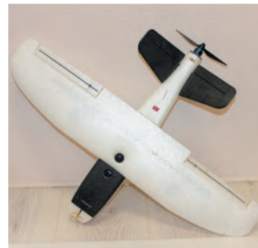
Беспилотники — эффективное средство разведки на поле боя

— Всё подобрано, закуплено, доведено до ума и доставлено фондом «Ленинградский рубеж»: машина водоочистки, мобильная станция РЭБ, тягач для рембазы и другое спецоборудование. Для фронта, для победы, — прокомментировал Александр Дрозденко.