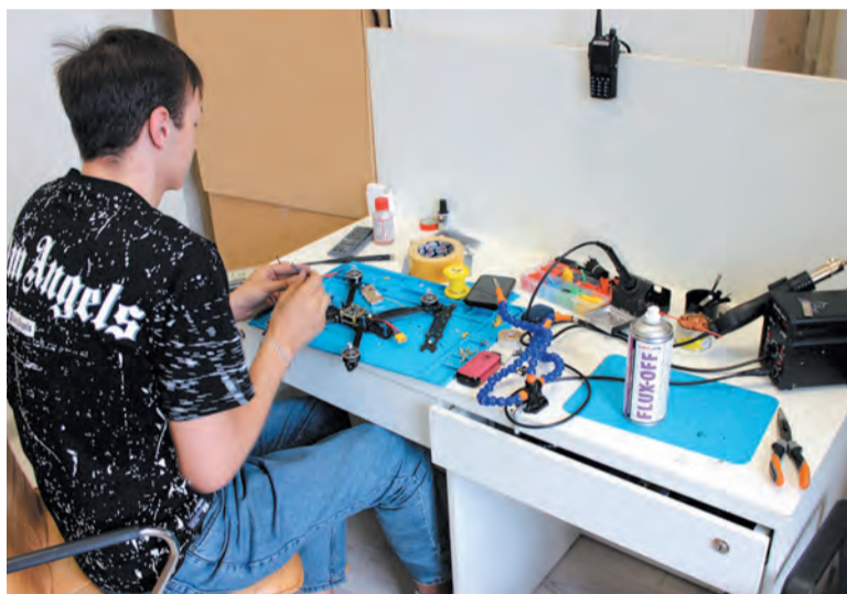
В Центре обучают сборке дронов и управлению ими

МАТЕРИАЛ ПОДГОТОВЛЕН ФОНДОМ «ЛЕНИНГРАДСКИЙ РУБЕЖ»