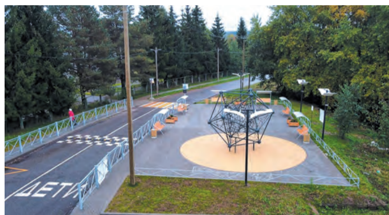
В 2024 году будут благоустроены общественные территории в 6 поселениях района

нику и малину. За 2023 год компании «Утконос» и «Нова ягода» вырастили 8,4 тонны земляники и почти 178 тонн малины.