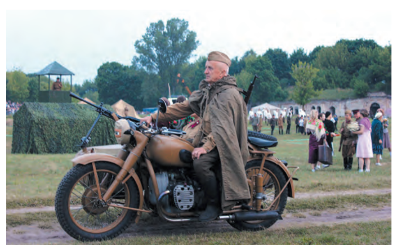
Театрализованное представление у стен Брестской крепости в честь Дня памяти и скорби