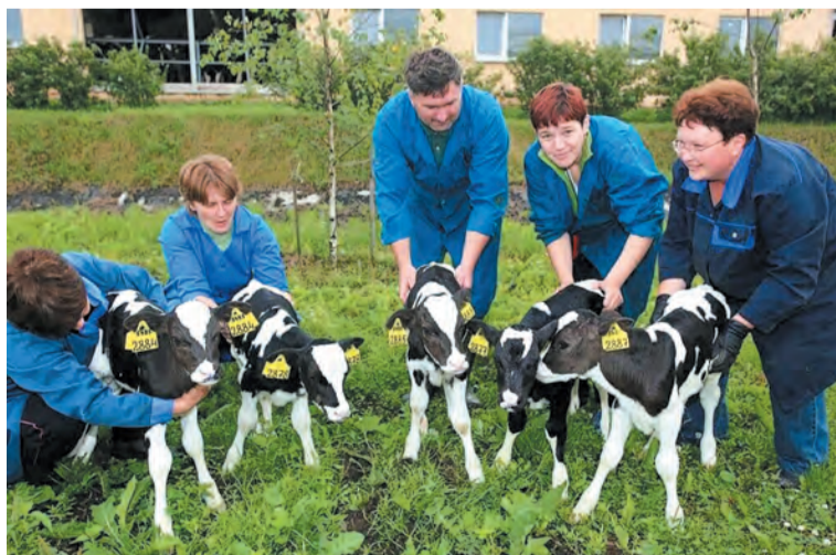
Приозерский район — лидер Ленобласти по продуктивности коров и валовому производству молока

селка) и Громово (Центральная площадь). Всего с 2017 года по президентской программе благоустроены 22 общественных пространства и 35 дворовых территорий. В 2024 году планируется благоустроить ещё 6 территорий в Приозерске, Громово,