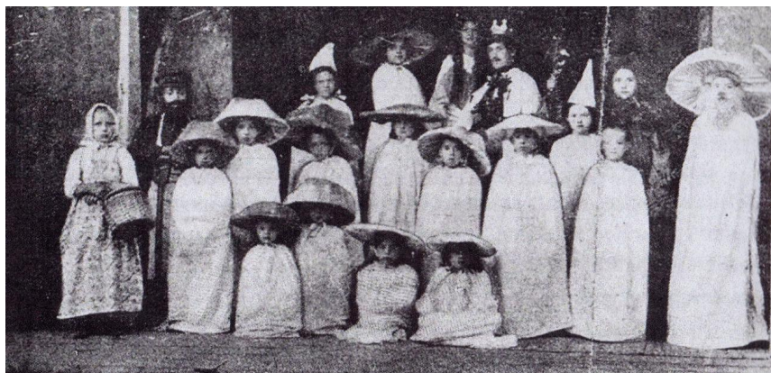
Дѣти, исполнители оперы въ м. Александровкѣ. По фот. Стуколкина*

Детские праздники тоже не обходились без театральных представлений. Иногда дети готовили для себя праздник сами.