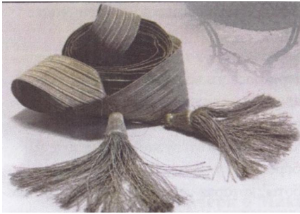
Пояс от традиционного наряда кормилицы, подаренный императором Александром III, 2-я половина XIX в. (из фондов Тосненского историко-краеведческого музея)