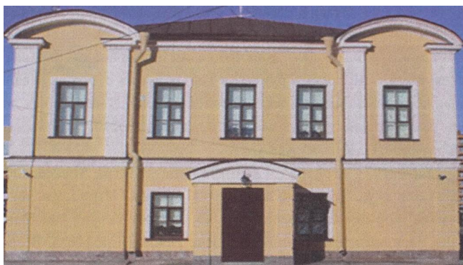
Дом царской кормилицы, бывший дом Смолиных

Царские кормилицы – простые русские женщины, которых было много на Руси. Одна из них жила в Тосненской ямской слободе, являясь хозяйкой дома, который до сих пор стоит на пересечении улиц Советской и проспекта Ленина в центре современного города Тосно. Немного осталось в городе старых домов, переживших время, события, людей, но каждый из них, как правило, имеет свое имя или легенду. Имеет свою историю и дом Смолиных. Построен он в середине XIX в. и впоследствии получил название «Дом царской кормилицы». Здесь проживала семья Смолиных, молодая хозяйка которой была взята в царские покои Александра III в качестве кормилицы первенца, маленького Ники, будущего императора Николая II.