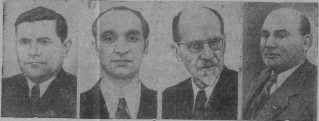
Заместители Председателя Президиума Верховного Совета СССР, набравшие VIII Сессией Верховного Совета СССР. На снимке (слева направо): Ф. Г. Бровко, Ю. И. Палыкин, А. М. Жиряков и Н. Я. Барес.

Нормы выработки надо использовать для организации и расширения социалистического соревнования. Видя конкретные задания, учитывая свои силы и способности, используя опыт работы передовиков сельского хозяйства, каждый колхозник и колхозница смогут взять на себя обязательства, направленные на перевыполнение норм, на дальнейший расцвет коллективного хозяйства.