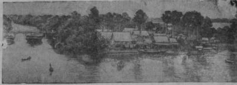
Дренина на реке Моконг в Нидо-Кхато.

Труды Н. С. Курнакова в области физико-химического анализа, по котлингическим сплавам и слезам пользуются мировой известностью. Выдающаяся научная деятельность ученого получила высокую оценку. В 1936 году ему была присуждена первая Менделеевская премия. В 1939 году советское правительство наградило его орденом Трудового Красного Знамени. На днях за этой последняя многолетний труд, в котором обобщены теоретические и практические исследования по физико-химическому анализу, ученым был удостоен Сталинской премии. (ТАСС).