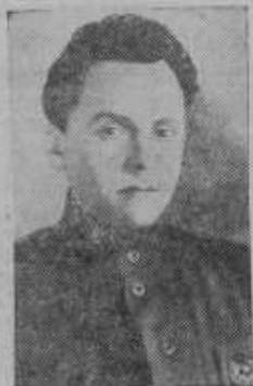
15 марта исполняется 15 лет со дня смерти гениального советского писателя Д. А. Фурманова. На снимке: Д. А. Фурманов.