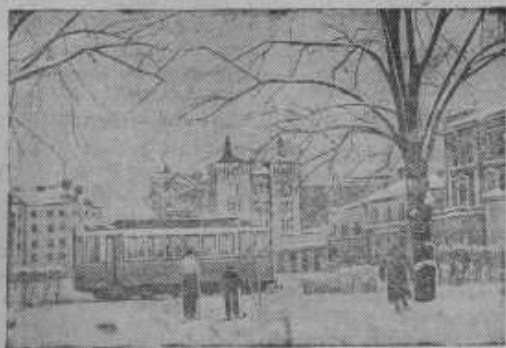
Город Виннури. Вид со стороны Городевого парка на Карельскую улицу.