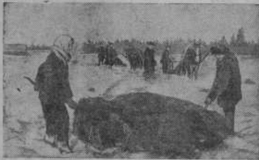
Подготовка к весеннему севу. Колхоз „Красная площадь“ (Псковский район, Ленинградской области) успешно готовится к весеннему севу. Страховые и семенные фонды засыпаны и пропашены на похозяйстве. Сельхозинвентарь полностью отремонтирован. На поля вывезены химические удобрения. В ближайшее время будет закончен завоз местных удобрений. На снимке: завоз местных удобрений на поля. Фото Я. Равяского (Фотохроника ТАСС).