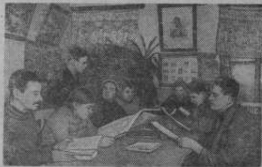
В библиотеке клуба колхоза „Красная Искра“, Ворошиловского района, свыше 5 тысяч книг. В читальне регулярно проводятся беседы на различные темы. Для обслуживания соседних колхозов выделен передвижной фонд библиотеки. На снимке: в читальном зале.