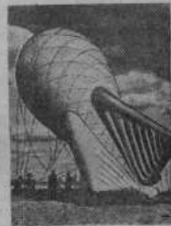
На снимке: германский самолет над окупленной территорией.