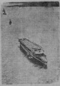
На снимке: английский авианосец "Фьюриос" в Средиземном море.