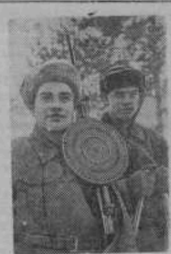
В Вырицком зимнем лагере Ленинградского городского совета Осоавиахима. На снимке: Отличница образной учебы.