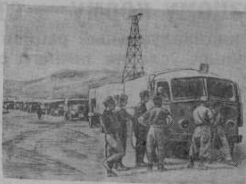
На африканском фронте. На снимке: итальянская автоколонна в Маржарино (область в Ливии).

Г. Кованько, зав. районным педкабинетом.