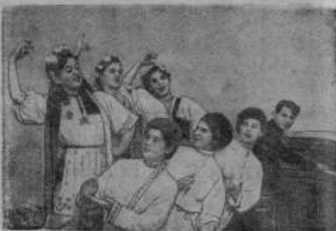
К показу театрализованно-музыкального искусства и художественной самодеятельности Ленинградской области. На снимке: Украинский госизд в исполнении театральной группы Дома культуры торфоразработки «Нава» (Мгинский район). Группа примет участие в заключительном концерте художественной самодеятельности области.