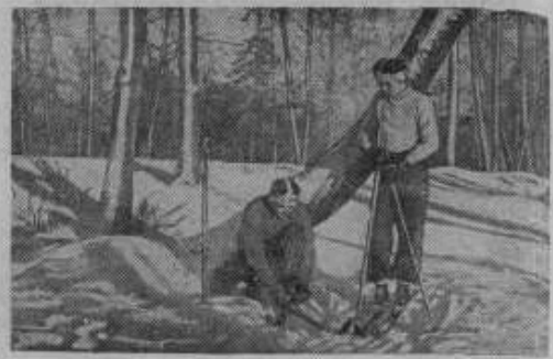
В центральном парке культуры и отдыха им. С. М. Карлова (Ленинград). На снимке: на лыжной прогулке.