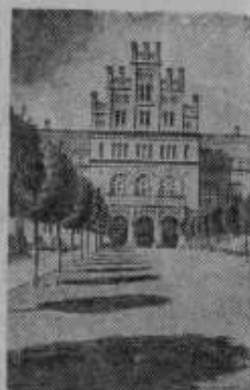
Историко-этнографический музей в г. Черноводске (УССР). До организации Советской власти здесь была резиденция митрополита.

Секретарь Ленинградского обкома ВКП(б) Т. ШТЫКОВ